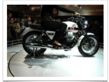
Una linea stupefacente