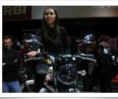
V 7: un unico grande occhio