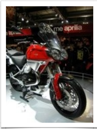
La vista migliore è di tre quarti